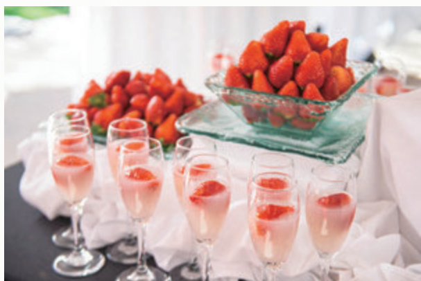
▲ 在美國舉辦的公關活動

以泰國、新加坡、馬來西亞等東南亞國家為主的出口實績,以及所舉辦的各種公關活動,均大獲各界人士的好評。